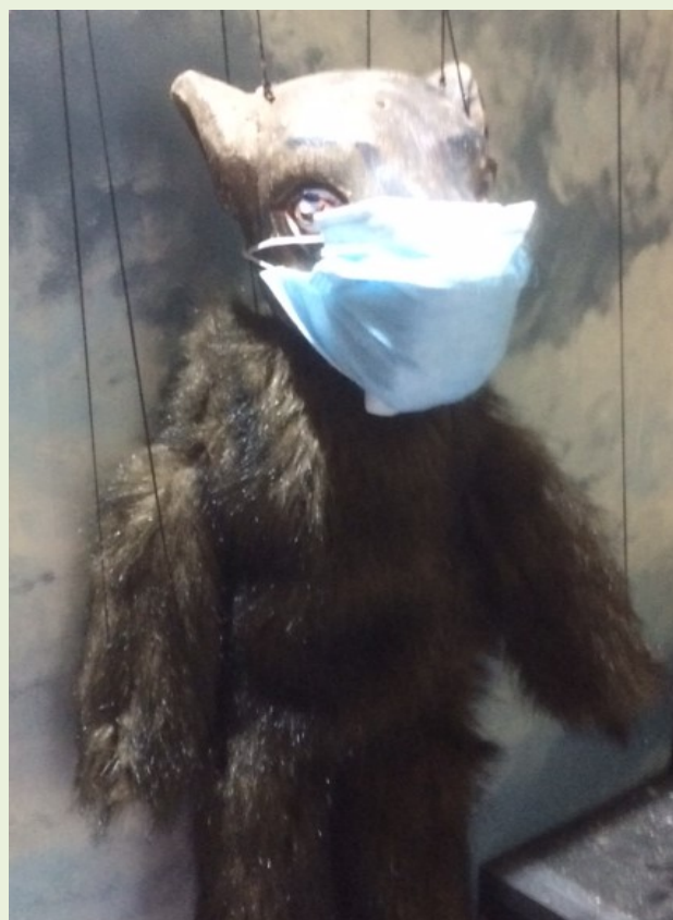
Ik had beter geen look gegeten (B.V.)

Kinderen worden betrokken bij het verhaal van Olleke bolleke tot lene miene mutte, waar naast creativiteit, muziek een belangrijke rol in speelt!