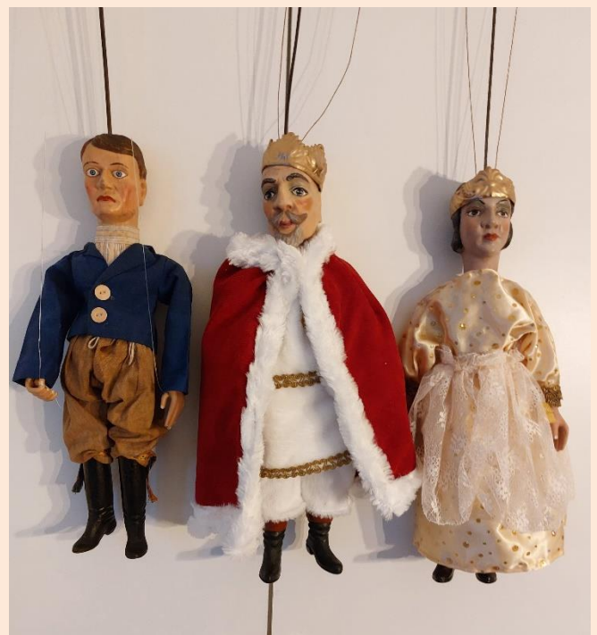
Een drietal gerestaureerde Munzberger stangpoppen

Antonín Münzberg was de eigenaar van de oudste Tsjechische poppenfabriek in Praag. Hij specialiseerde zich in de productie van familie-, school-, verenigingstheaters en poppen in een zeer hoogwaardige maar technisch eenvoudige vormgeving. In 1912 begon het bedrijf met de productie van de poppen De poppen werden geproduceerd in drie maten van 18 – 25 – 35 cm met houten lichamen, hoofden gegoten uit gips en werden telkens zorgvuldig gekostumeerd. Het bedrijf van Antonín Münzberg hield in wezen op te bestaan tot 1954 met de dood van Münzberg. Zijn zoon mocht dit bedrijf niet meer voortzetten, dus vernietigde hij alle gegevens die nodig waren voor de productie.